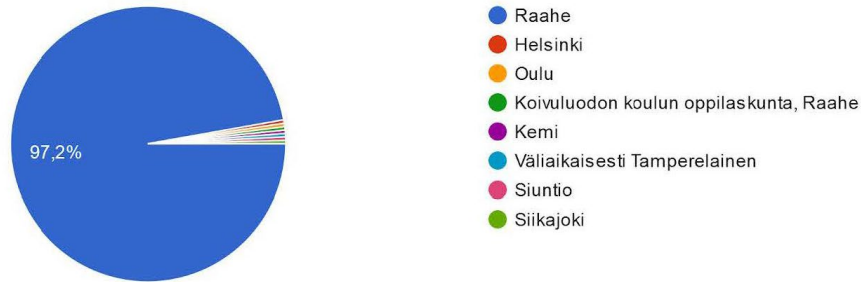
Kuva 2 Kaaviossa on esitetty kyselyn vastaajien kotipaikkakunta. Noin 97 % vastaajista asuu Raahessa.