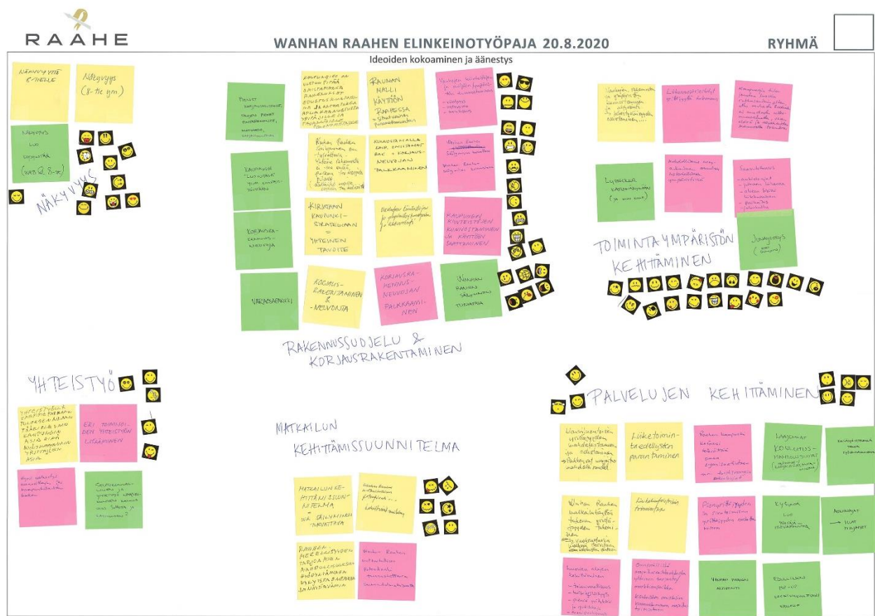
Kuva 2: Kehittämisideat esitettiin Post it-lapuilla ja koottiin yhteen ryhmiksi. Ideoiden äänestys tapahtui tarralapuin. Suosituimmat kolme valittiin jatkotyöstöön.

Ensimmäisessä vaiheessa valittiin kolme puhuttelevinta kehittämisideaa ennakkotehtävässä annetuista ideista, jonka jälkeen samaa tarkoittavat ideat ryhmiteltiin seuraavien otsikoiden alle.