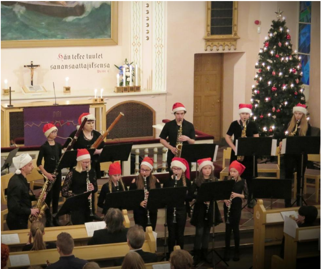
Puupuhallinyhtye Joulukonsertissa Raahen kirkossa, ohj. Jari-Veikko Leppäsalo