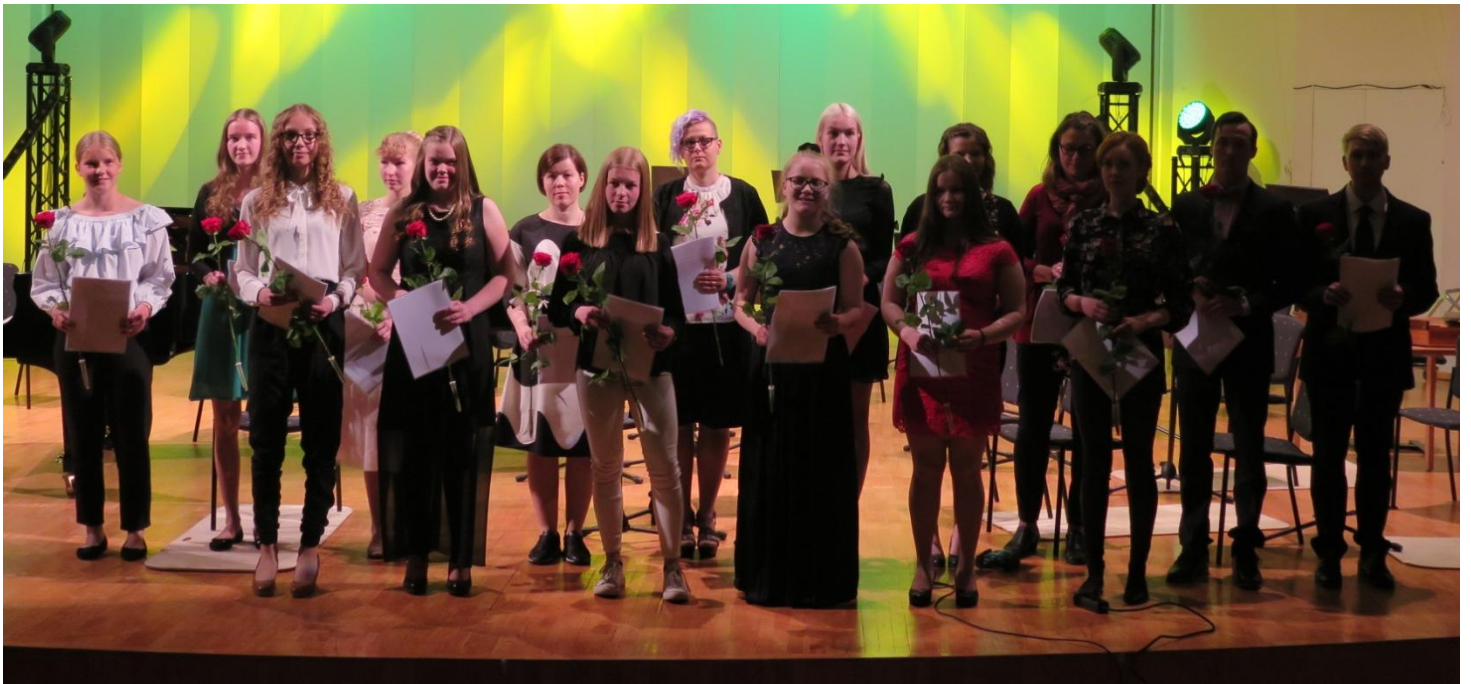
Päättötodistukset jaettiin Kevään juhlakonsertissa Raahesalissa