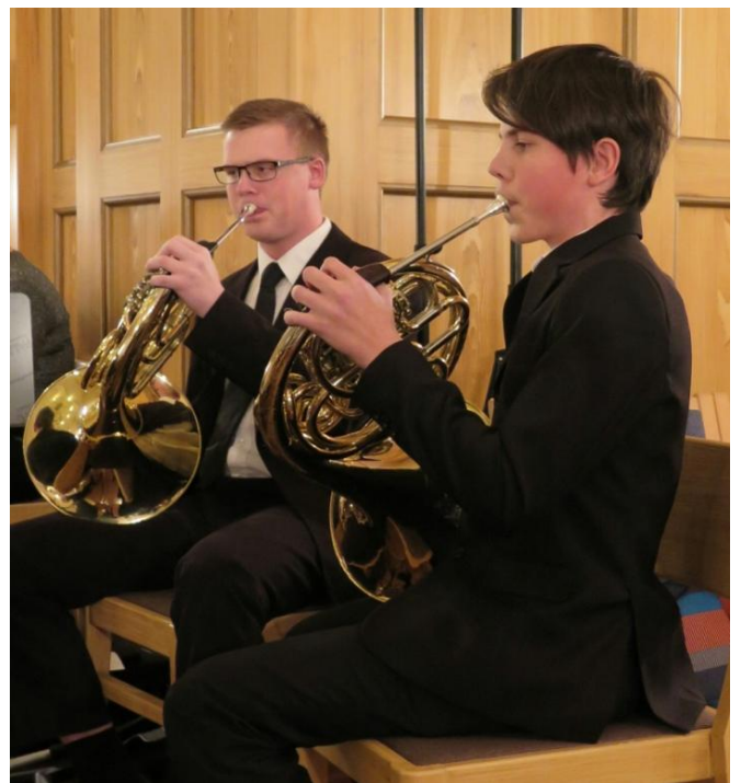
Raahen Kamut, Juniorijousiorkesterin soittajia ja Vaskikvartetin käyrätorvensoittajat Joulukonsertissa Raahen kirkossa