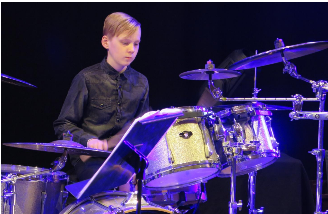
I-Scream-bändin rumpali Tuulessa soi –viihdekonertissa toukokuussa 2018 Raahesalissa