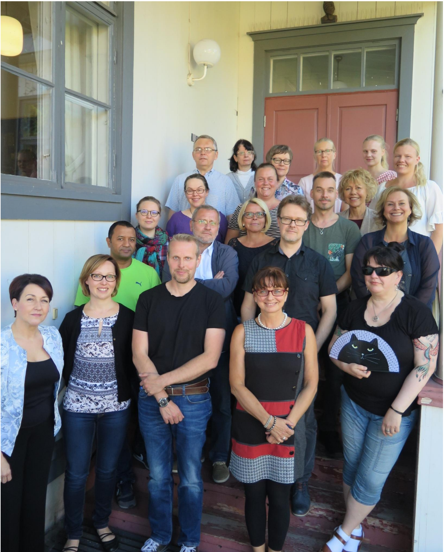
Raahen musiikkiopiston opettajat ja rehtori hyväntuulisessa yhteiskuvassa lukuvuoden alussa