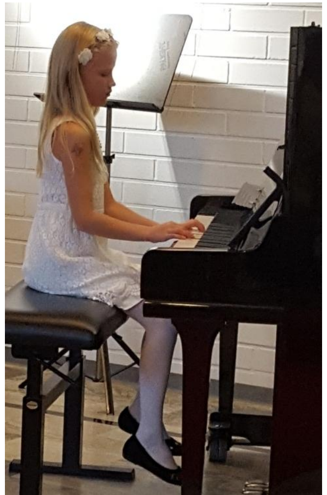
Pianisti soittamassa Aaltojen salaisuus – satukonsertissa kirjastossa lokakuussa 2017