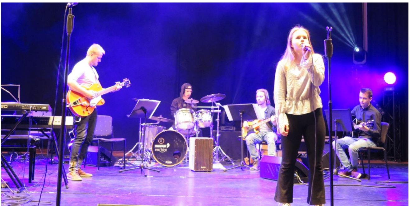
Tuulussa soi –viihdekonsertti toukokuussa 2018 Raahesalissa

Musiikin kaikissa opetusryhmissä ja opintotasoilla esiintyminen säännöllisesti erilaisissa tilaisuuksissa on osa musiikkiopintoja. Oppilaskonsertit ja musiikkituokiot pitkin lukuvuotta ovat antaneet tähän hyvät mahdollisuudet. Musiikkikasvatuksessa on pyritty myös korostamaan nuoren normaaliin elämäntilanteeseen kuuluvien esiintymismahdollisuuksien hyödyntäminen kuten esimerkiksi koulujen ja seurakuntien tilaisuudet sekä erilaiset perhejuhlat. Näiden myötä nuoren käytännön muusikkous on saanut mahdollisuuden kasvaa luontevasti. Opintoihin kuuluvia tasosuorituksia on järjestetty mahdollisuuksien mukaan konserttimuotoisina. Halutessaan oppilaalla on kuitenkin ollut oikeus tasosuoritukseen pelkästään lautakunnalle.