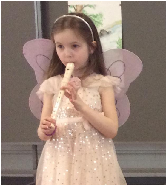
Musikanttien tuokio kirjastossa