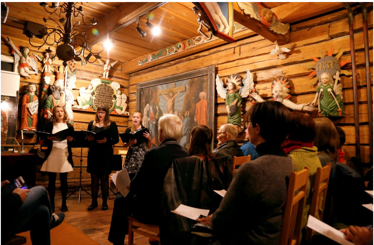
Barokkituokio Raahen museossa lokakuussa 2017

Raahen musiikkiopisto on myös vahvasti alueellinen kulttuuritoimija, joka järjestää säännöllisesti konsertteja ja musiikkitapahtumia. Musiikkiopiston toimintaan kuuluvat olennaisesti musiikkikulttuurin edistämiseen ja kehittämiseen liittyvä toiminta. Taideyhteistyö perusopetuksen ja muiden alueellisten toimijoiden kanssa on jatkuvaa.