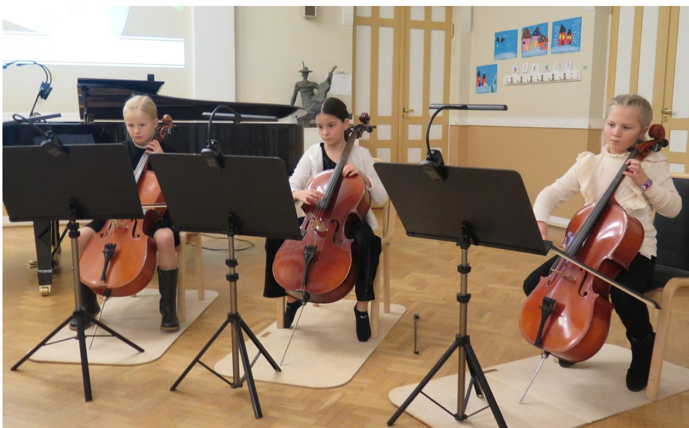
Sellotrion esitys kamarimusiikkikonsertissa joulukuussa 2022.

Oppilasta pyritään innostamaan musiikin pitkäjänteiseen opiskeluun ja musiikillisten taitojen kehittämiseen. Opintojen lähtökohtana ovat oppilaan vahvuudet ja kiinnostuksen kohteet. Monipuolisen musiikillisen toiminnan myötä musiikin perusopinnot kehittävät oppilaan musiikillista ja luovaa ajattelua.