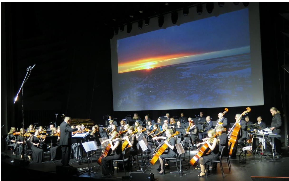
Raahen Sinfonietta ja Raahen Puhallinorkesteri Sävelten siivin -konsertissa tammikuussa 2026 kulttuuripääkaupunkivuoden Raahen avajaisissa Raahesalissa.

Musiikkiopiston pitkäaikainen yhteistyökumppani on Raahen Puhallinorkesteri, jossa soittaa osa opinnoissaan pidemmällä olevista puhallinsoitinopiskelijoista. Yhteistyötä toteutetaan myös niin, että musiikkiopisto antaa orkesterille välineistöä harjoituksiin ja konsertteihin. Merkittäviä yhteistyökumppaneita musiikkiopistolle ovat myös Raahen seurakunta ja Raahen kaupungin kulttuuritoimi. Musiikkiyhteistyö pitää yllä kulttuuritoiminnan monipuolisuutta toimintaa ja rikastuttaa toimintatapoja.