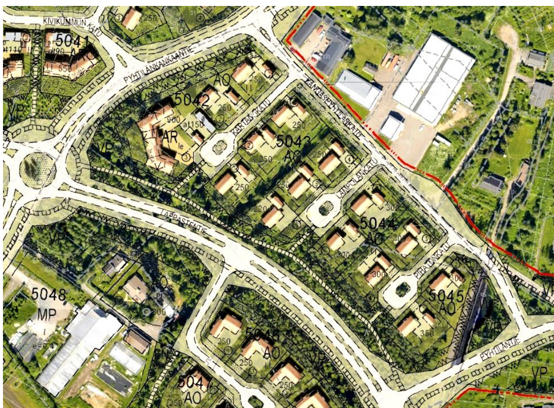
Havainnekuva, Pyhtilänkankaan korttelialueet 5042 - 5045.

Istutettavat alueen osat on merkitty asemakaavakartalle.