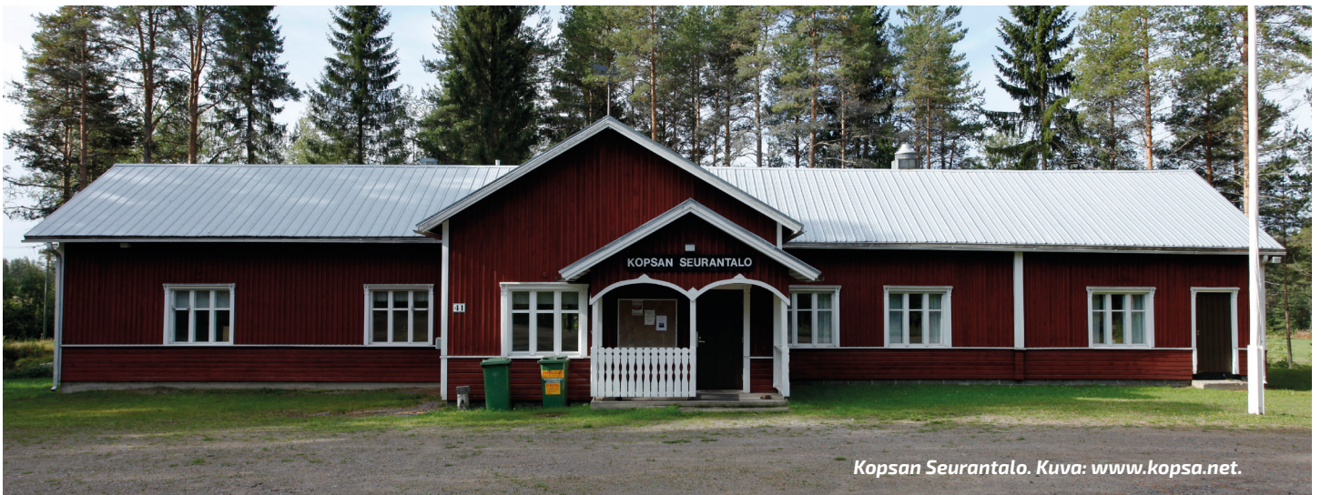
Kopsan Seurantalo.