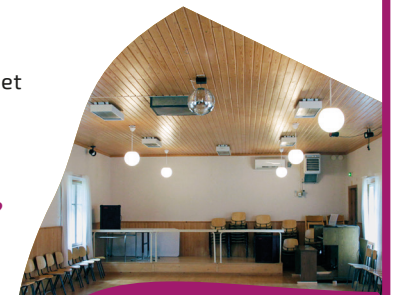
Kopsan Seurantalon salia.