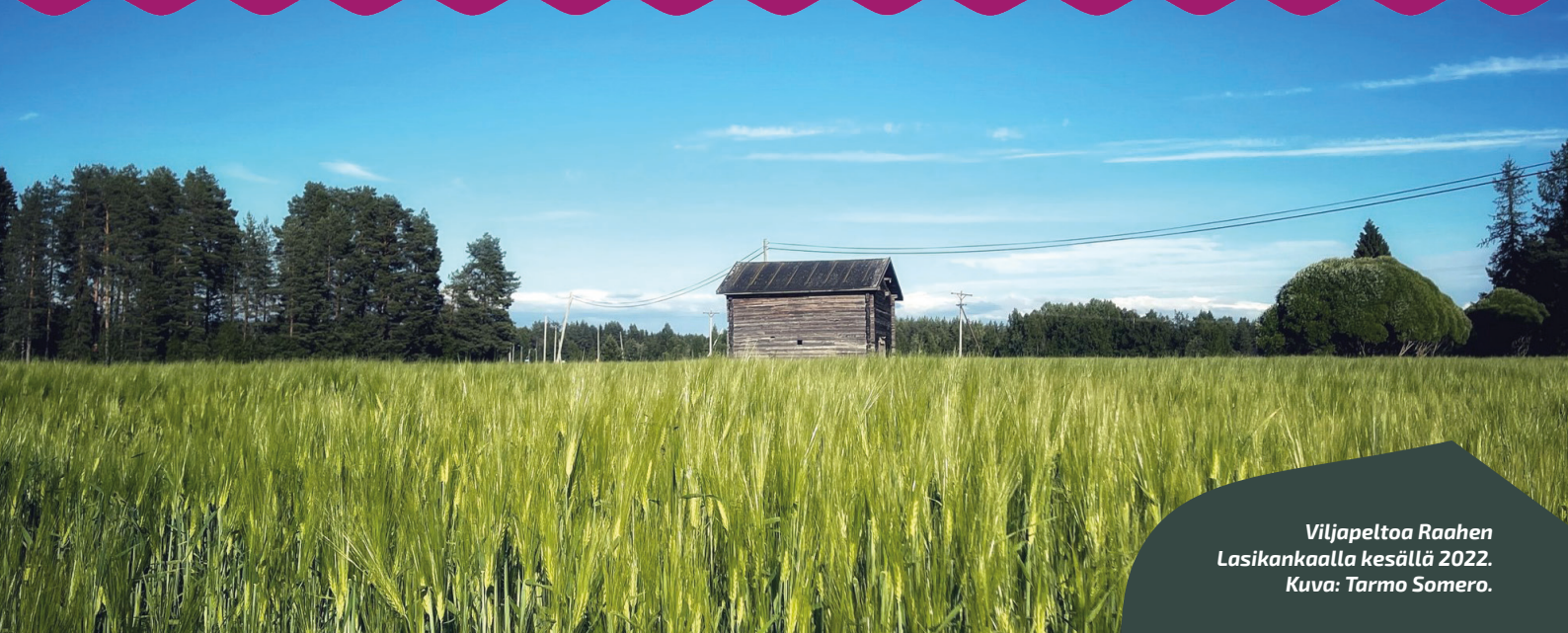
Viljapeltoa Raahen Lasikankaalla kesällä 2022.