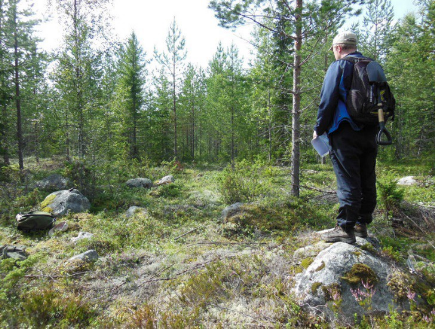
Kuva 7. Rakkakivikko. Sitä oli usean kymmenen metrin alalta. Tarkastellaan, olisiko tässä merkkejä rakenteista.