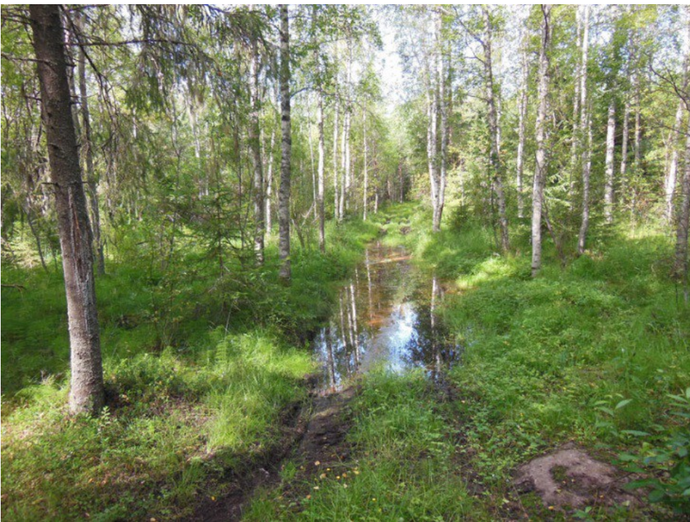
Kuva 6. Inventoiva alue oli välillä vaikeakulkuista.