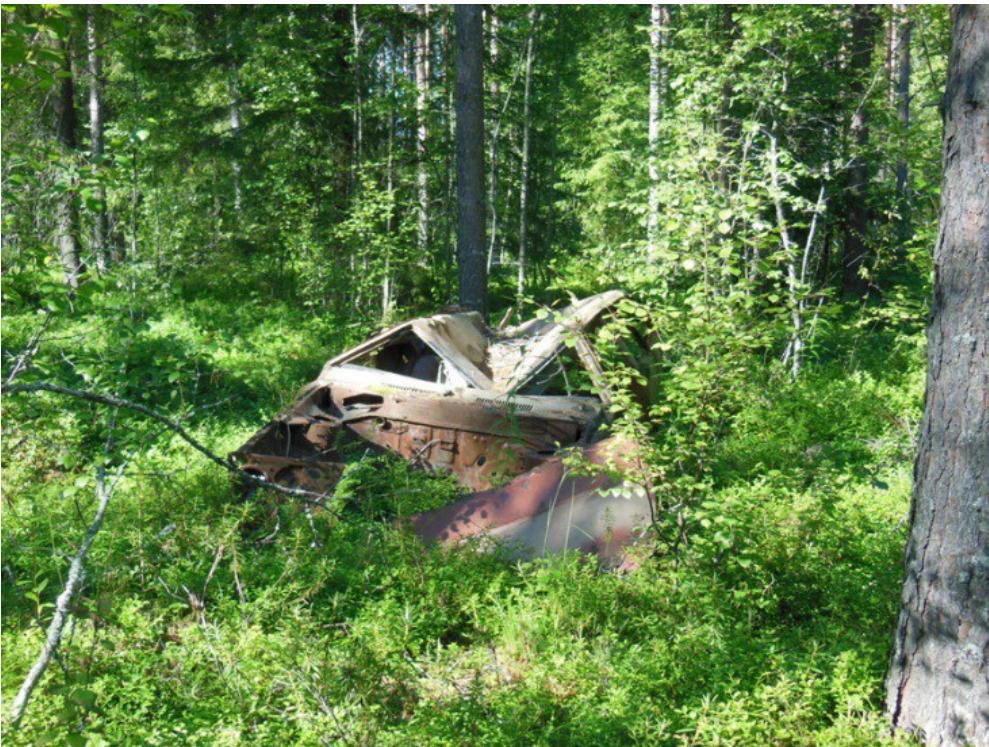
Kuva 4. Ruostunut auton jäännös.