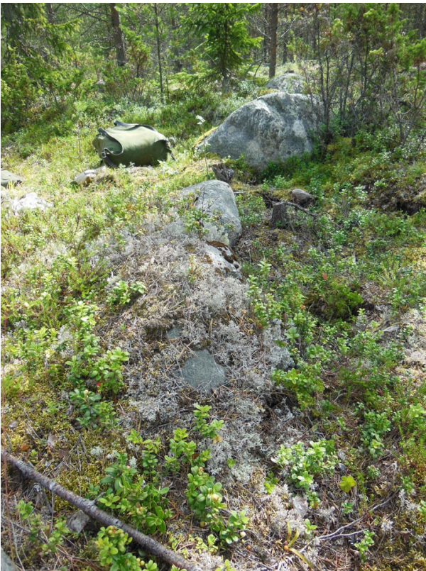
Kuva 8. Mahdollista kivrakennetta. Repun kohdalla isompien kivien välissä oli kiviä turpeen alla.