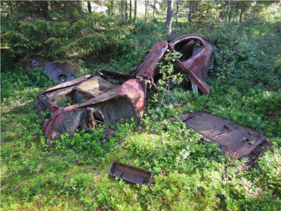
Kuva 3. Ruostunut auton jäännös.