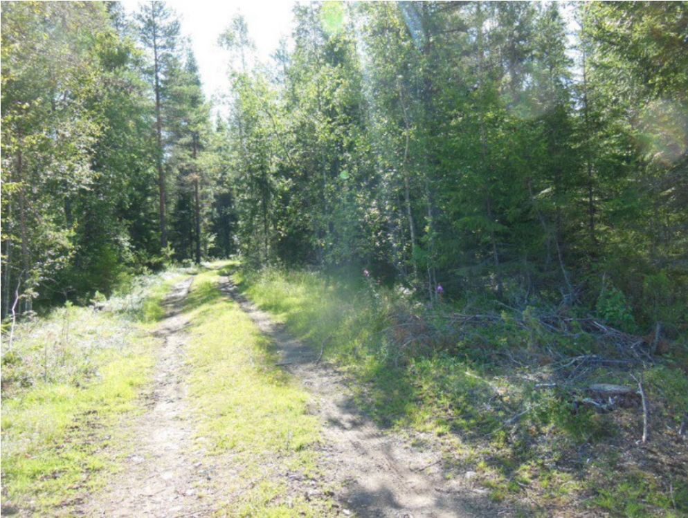
Kuva 5. Inventoitavaa aluetta. Korkeat alueet olivat etusijalla.