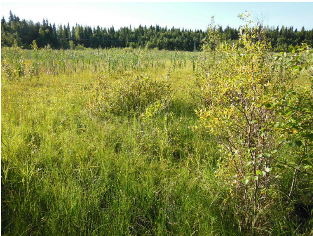
Kuva 2. Pattijärvet oli kasvanut lähes umpeen. Kuva länteen.