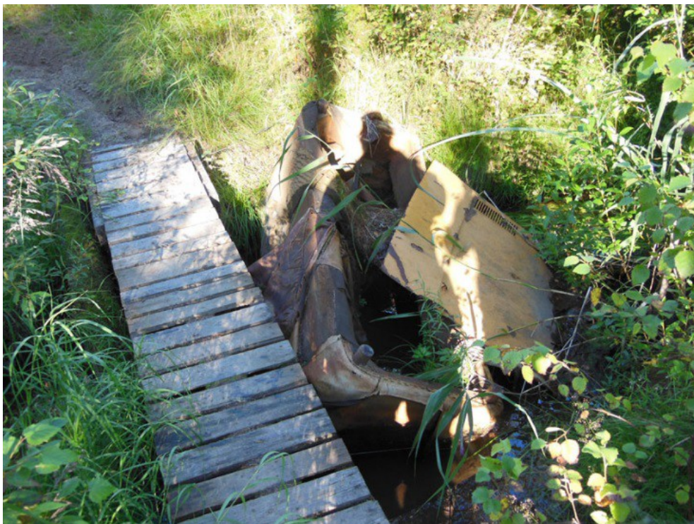
Kuva 1. Inventoitavalla alueella kulki runsaasti oja. Kuvassa näkyy sohva ojaan heitettynä.